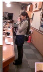
立ってお昼食べに 行ったことも...