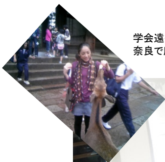
学会遠征の際に 奈良で鹿と♪