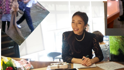
10周年パーティの受付で とびきりスマイル☆