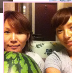
いつも2人で仲良く♪